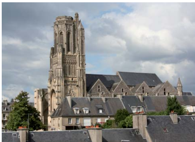
ci-dessus : collégiale Notre-Dame

La matinée sera consacrée à la haute ville de Saint-Lô (L'Enclos). La visite des remparts, de la collégiale Notre-Dame et de la tour de la Poudrière sera l'occasion d'évoquer l'histoire de cette partie de la ville et les choix de la reconstruction. Le substrat rocheux particulier de ce secteur du Cotentin a donné son nom à un