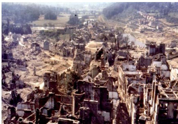
ci-dessus : Saint Lô en 1944