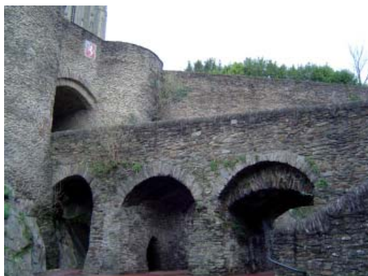
ci-contre : entrée principale dans le rempart