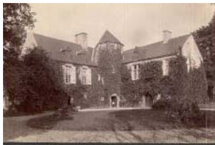
en haut : vue de la Vire à Saint Lô. ci-dessus : manoir du Mesnil-Vitey ci-contre : four de Porribet